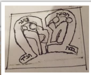
תנה רייזל בנין כיתה ה'